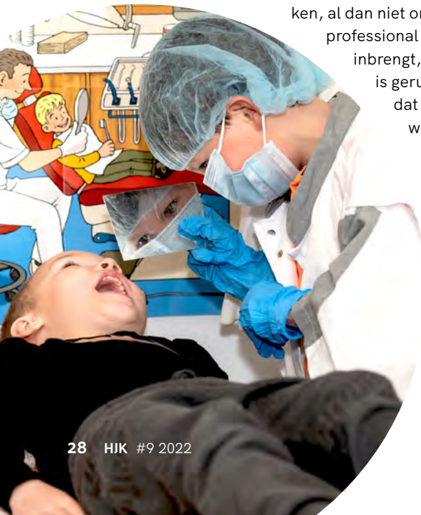
Rollenspel waarin kinderen woorden in een functionele context van het spel gebruiken, biedt veel kansen

Beide invalshoeken (incidenteel en intentioneel) liggen in elkaars verlengde. Het ene kan niet zonder het andere. Je kunt er niet van op aan dat incidenteel alle woorden voldoende aanbod komen en door alle kinderen worden opgepikt. Juist de kinderen met een minder ontwikkelde woordenschat hebben extra steun nodig, omdat ze tegen te veel onbekende woorden aanlopen. Je helpt ze enorm door systematisch welgekozen woorden uit te lichten en expliciet aan te bieden voorafgaande aan de activiteit. Hun woordenschat wordt daarmee niet alleen stelselmatig vergroot, het opent ook de weg naar het incidentele leren tijdens de activiteit. De kinderen begrijpen waar het over gaat en in het rijke taalklimaat kunnen ze nieuwe betekenissen en andere, verwante, woorden aanhaken. Expliciete instructie roept soms beelden op van aparte lesjes en rijtjes losse woorden en ‘drills’. Dat past niet alleen totaal niet bij het kleuteronderwijs, het is ook een weinig effectieve manier van woordenschat uitbreiden (Blachowicz e.a., 2006). Expliciet woordenschatonderwijs kan en moet (!) heel speels, uitdagend en enthousiasmerend zijn. En vooral kort en krachtig. Met een intentionele en incidentele insteek dus. De leerkracht creëert een rijke context