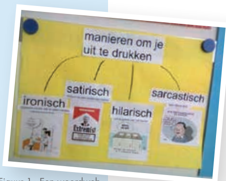
Figuur 1 - Een woordweb

Meester Roel heeft met zijn groep 7 bedacht dat iedere week twee kinderen een graphic organizer (visualisatie van aangeboden woorden, zoals bijvoorbeeld een woordweb) ontwerpen die de aangeboden woorden van die week weergeven. Dit scheelt veel werk voor hem en de kinderen leren welke graphic organizer bij de nieuwe woorden past.