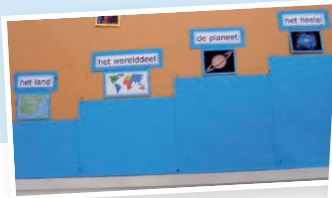
Figuur 2 - Een woordtrap

Meester Roel heeft lang gewerkt aan het vormgeven van een woordenschatcultuur in zijn groep 7. De kinderen en hijzelf zijn razend enthousiast. Als we in zijn groep komen, zien we een prachtige woordenmuur waarop in een woordtrap (zie figuur 2) en een woordparachute (zie figuur 3) de aangeboden woorden van de afgelopen twee weken hangen. Daarnaast zien we een breed aanbod van verschillende soorten boeken en ook verschillende woordenboeken. Meester Roel heeft net een les gegeven over homoniemen (twee dezelfde woorden die een verschillende betekenis hebben, zoals arm en arm). Op de deur hangt een rol behang en de kinderen mogen daarop hun zelfbedachte woorden schrijven. In tweetallen wordt er enthousiast en geconcentreerd nagedacht over nieuwe homoniemen. De hele week mogen ze nieuwe woorden erbij schrijven en op vrijdag wordt er gekeken hoeveel er gevonden zijn. Uiteraard mogen de kinderen ook thuis met hun ouders nadenken over nieuwe homoniemen.