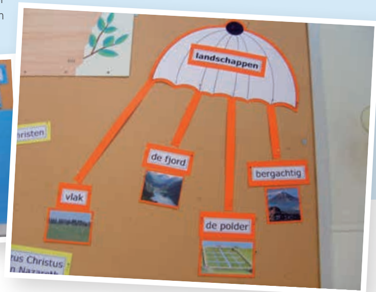
Figuur 3 - Een woordparachute

aangeleerde woorden regelmatig opnieuw oppakken en meer betekenisaspecten aan deze woorden verlenen.