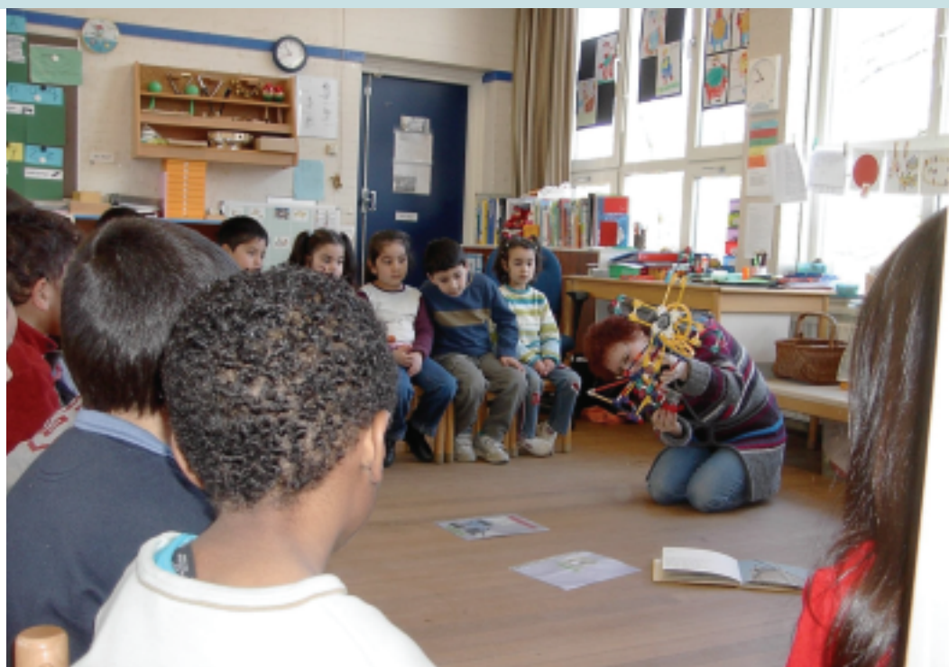
In groep 1-2 van de Slootermeerschool in Amsterdam onderzoeken de kinderen het molentje